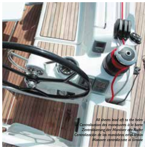
All sheets lead aft to the helm Centralisation des manœuvres à la barre Zentralisierung der Manöver am Ruder Centralización de las maniobras en el timón Manovre centralizzate al timone