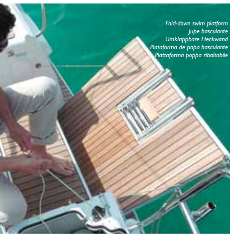
Fold-down swim platform Jupe basculante Umklappbare Heckwand Plataforma de popa basculante Piattaforma poppa ribaltabile