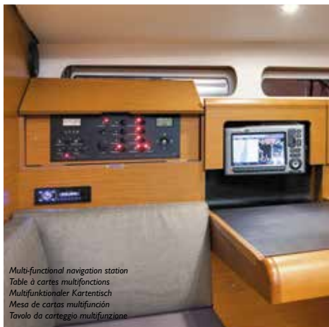
Multi-functional navigation station Table à cartes multifonctions Multifunktionaler Kartentisch Mesa de cartas multifunción Tavolo da carteggio multifunzione