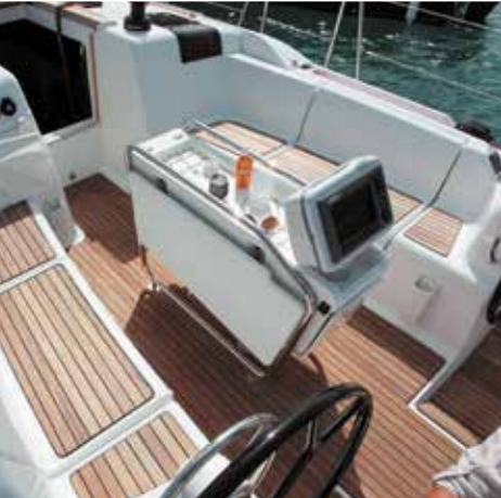
Composite wheels* Barre à roue en composite* Ruderrad aus Verbundstoff* Timón de composite* Ruota del timone in composito* *Option