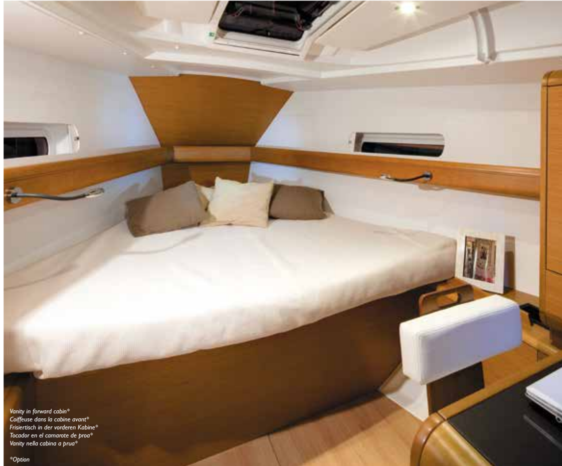
Vanity in forward cabin* Coiffeuse dans la cabine avant* Frisirtisch in der vorderen Kabine* Tocador en el camarote de proa* Vanity nella cabina a prua*