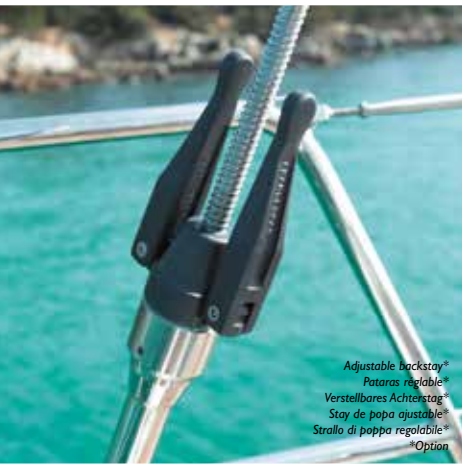
Adjustable backstay* Pararas réglable* Verstellbares Achterstag* Stay de poppa ajustable* Strallo di poppa regolabile* *Option