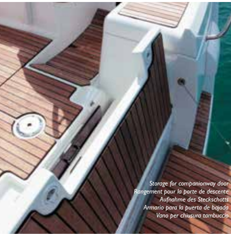
Storage for companionway door Rangement pour la porte de descente Aufnahme des Steckschotts Armario para la puerta de bajada Vano per chiusura tambuccio