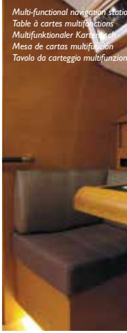
Multi-functional navigation station Table à cartes multifonctions Multifunktionaler Kartentisch Mesa de cartas multifunción Tavolo da carteggio multifunzione