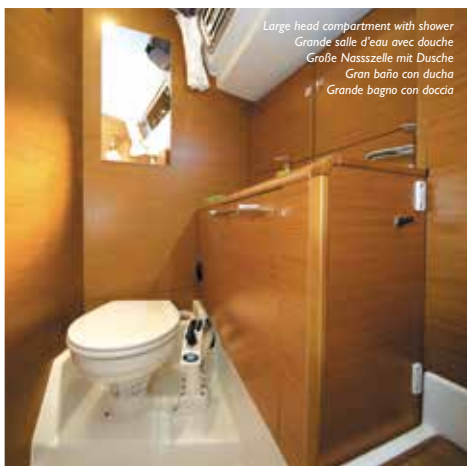
Large head compartment with shower Grande salle d'eau avec douche Große Nasszelle mit Dusche Gran baño con ducha Grande bagno con doccia