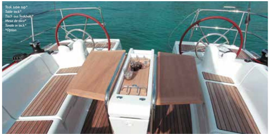
Teak table top* Table teck* Tisch aus Teakholz* Mesa de teca* Tavolo in teck* *Option