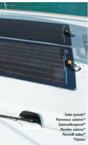
Solar panels* Panneaux solaires* Solarzellenpanel* Paneles solares* Pannelli solari* *Option