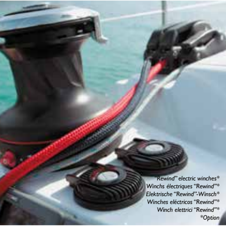
*Rewind* electric winches* Winchs électriques "Rewind"* Elektrische "Rewind"-Winch* Winches eléctricos "Rewind"* Winch elettrici "Rewind"* *Option