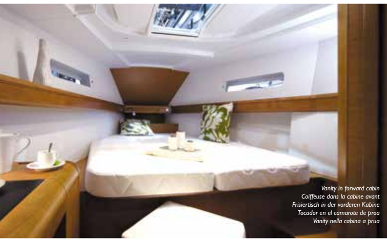
Vanity in forward cabin Coffeuse dans la cabine avant Frisiertisch in der vorderen Kabine Tocador en el camarote de proa Vanity nella cabina a prua